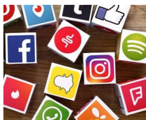
SOCIAL MEDIA MARKETING